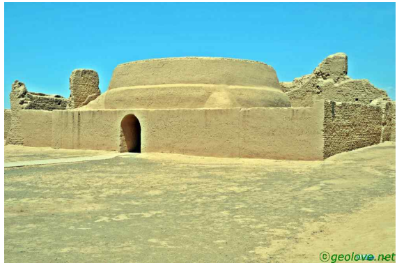
사진 9. 고창고성

화염산의 골짜기에는 베제클리크 천불동이 자리하고 있다. 베제클리크 천불동은 바위를 깎아 만든 77개의 석굴이다. 대부분 사각형의 공간에 둥근 아치형 천장을 하고 있으며 불화 벽화가 그려져 있다. 이 동굴들에는 천장 전체가 수십 점의 불화로 그려진 벽면으로 되어 있다. 19세기 말, 20세기 초에 걸쳐 많은 부분이 도굴되고 파손되었지만, 여전히 그 아름다움을 자랑하는 불화들로 채워져 있다. 하지만 중요한 것은 보여주지 않고, 그나마 사진을 못 찍게 한다. 두 사람이 우릴 감시하느라 줄줄 쫓아다녔다. 신기하게도 이곳의 벽화는 우리나라에 가장 많이 남아 있다고 한다. 일본