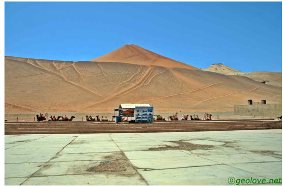
사진 10. 화염산