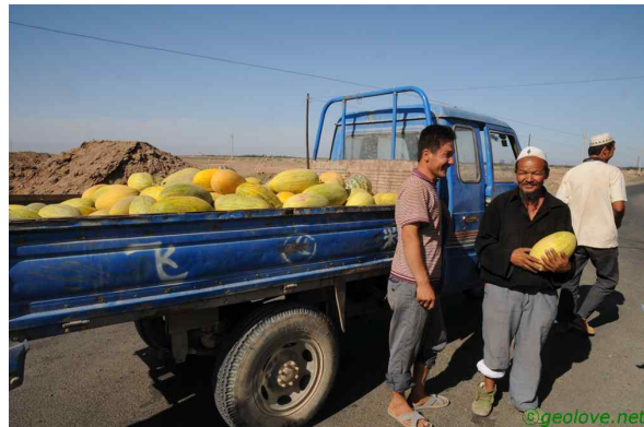
사진 5. 하미과를 파는 위구르인

가이드의 말로는 오늘 낮 기온이 42℃까지는 오를 것이라 한다. 그런 날씨에 육지에서 가장 낮다고 하는 아이딩호를 간다. 아이딩호로 가는 길은 쉽지 않았지만 어렵지도 않았다. 중국 신장지구의 대부분이 그러하지만 도로에서 표지판을 찾아보기 어려웠다. 화염산에 거의 다 이를 무렵 남쪽으로 길을 들었는데 삼거리를 만났다. 아무런 표지판이 없다. 게다가 길에서 우연하게 만난 사람들은 중국어를 하지 못한다. 위구르어를 사용하니 어찌면 당연한 일일지도 모른다. 말은 안 통하지만 그들의 마음을 읽을 수 있을 것 같았다. 이 지방의 특산품인 하미과를 팔러 가는 사람들이었다. 잠시 표지판을 찾으러 뛰어다니는 사이 동네잔치라도 벌어진 분위기였다. 같이 갔던 집 아이는 하미과 하나를 선물로 받았다고 좋아서 어쩔 줄을 모른다.