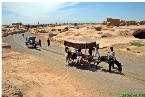
사진 8. 고창고성의 나귀차