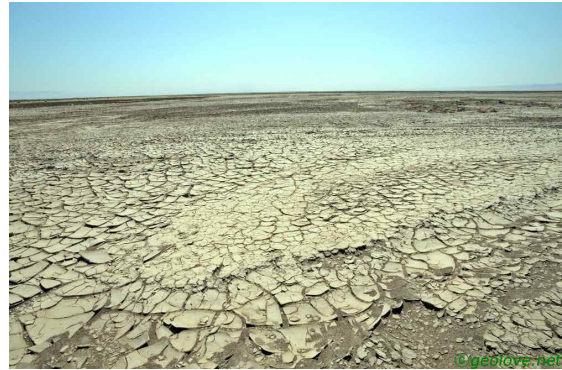
사진 6. 말라버린 아이딩호

고창고성은 두 번째의 방문이다. 차에서 일행에게 절대로 아이들이 파는 물건에 신경 쓰지 말라고 당부하였다. 이년 전의 경험에 의하면 일단 하나를 사면 벌떼처럼 달려들 것이라고. 다행이 일행은 그 말을 잘 따라주었다. 막상 그러고 나니 동네 아이들에게 미안한 마음도 들었다. 사탕 하나를 받아들고 맛있다고 아끼면서 먹는 아이들이 참 안됐다는 생각이 들었다. 가이드 말에 의하면 그 부모들은 교육에 별 관심이 없다고 한다. 오히려 돈 버는 방법을 빨리 익히는 것이 더 중요하다고 한다. 일행은 넷씩 나귀 차에 나누어 타고 입장하였다. 그 길을 곳곳하게 걷는 서양 사