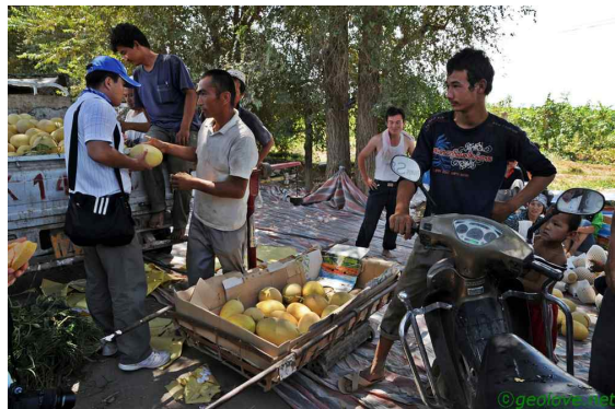
사진 7. 하미과를 파는 사람들