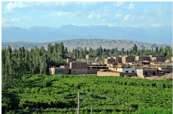
사진 13. 포도원과 포도 건조장