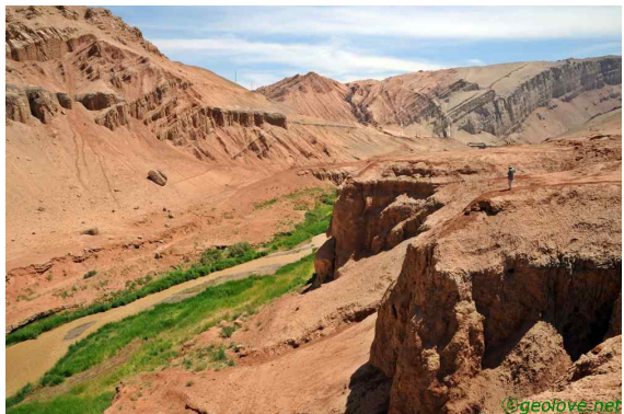
사진 11. 화염산 계곡