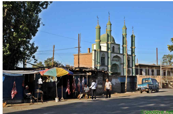
사진 2. 시골의 정육점과 회교사원