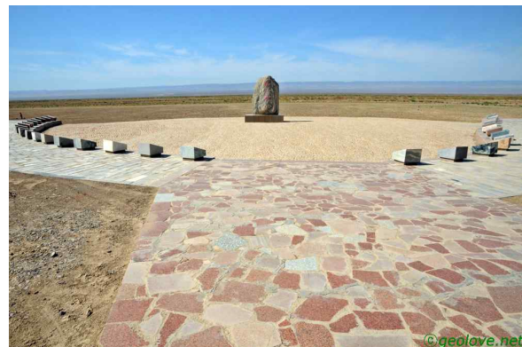
사진 4. 아이딩호 표지판

설레는 마음으로 아이딩호를 향하고 있다. 지난번에도 가고 싶었지만, 가이드가 ‘갈 수 없는 곳이다.’는 한 마디에 포기를 하였다. 애초에 약속하지 않았던 곳이라 더 이상 할 말도 없었다. 출발 전에도 웬지는 모르지만 여행사에서 아이딩호는 빼려고만 하였다. 그렇게 가기 힘든 곳이었다. 하지만 투루판에서 아이딩호까지는 그리 험한 길이 아니었다. 길에 표지판이 없어서 여러 번 길을 묻기는 하였지만, 험한 길은 아니었다. 마지막 200여m를 제외하고는 모두 포장길이었다(혹시라도 후에 그곳을 찾을 이들을 위하여 밝혀둔다).