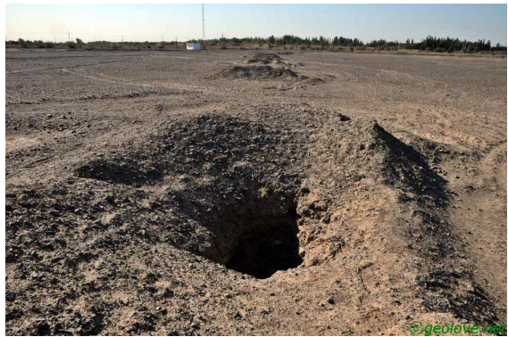
사진 12. 카레즈

오늘의 마지막 코스인 소공탑 차례이다. 소공탑은 이슬람 사원에 있는 것으로 44m의 높이로 중국에서 가장 높은 이슬람 탑이다. 이 탑은 청나라 건륭제 때인 1777년 시작되어, 1