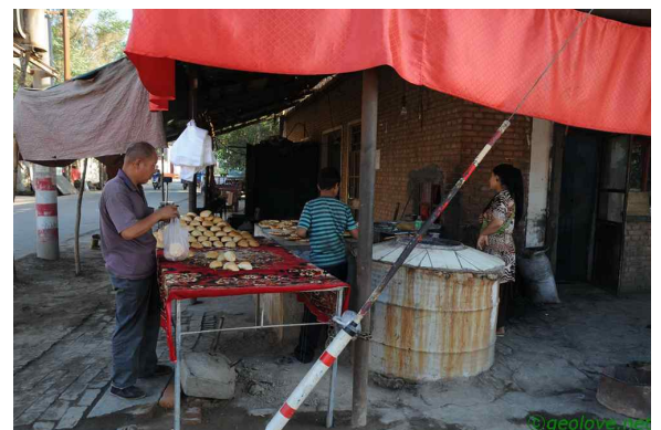
사진 3. 빵가게의 아침