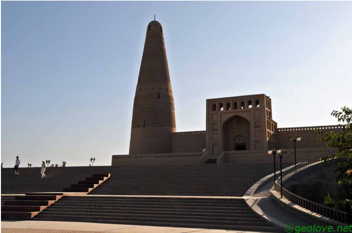
사진 14. 소공탑

년 만에 완성된 탑이다. 소공탑은 다른 위구르 모스크나 이슬람식 탑과 같이 이슬람 전통 양식과 위구르 전통 건축 양식을 결합한 것이라 한다. 소공탑의 마당은 해발 0m의 지점이다(전적으로 가이드의 말에 의한 것이며 신뢰하기 어려운 면이 있음). 주변은 온통 포도원으로 둘러싸여 있다. 이 년 전에는 금요일이라 기도 중이어서 안을 들여다보지 못하였다. 안은 밖의 화려함과 달리 소박하였다. 그것이 이슬람의 특징이라 한다. 잠시 뒤로 돌아가보니 사원의 공동묘지였다. 이년 전에는 보지 못하였던 공동묘지이다. 그러니 한 번 방문하고 모든 것을 보겠다는 것은 지나친 욕심이다. 공동묘지는 이슬람에서도 그 크기에 따라 지위와 신분이 들어난다고 한다. 아주 큰 묘지 옆에 양의 머리가 있는 것이 특이하었다. 묘지를 빠져나오니 저녁 7시이다. 하루가 이렇게 길다니! 바자르라도 들르고 싶지만 모두 만만한 기력이 아닌듯하다. 더구나 오늘 저녁은 미리 하는 파티가 있다. 뭐 별 것은 아니지만 양 바비큐가 기다리고 있다.