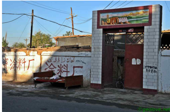
사진 1. 야외에서 자고 있는 아이와 침대

사거리의 한 모퉁이에서는 낭을 구워내느라 정신이 없다. 낭은 밀가루 반죽을 하고 적당하게 버터기름을 발라가면서 모양을 만들어서 화덕에서 구워낸 빵이다. 위구르족의 주식이다. 마치 낭 하나가 우리의 공깃밥 한 그릇을 대신한다고 생각되었다. 각 집에서 낭을 구워먹기도 하지만, 불편할 것 같다. 그래서인가 대부분