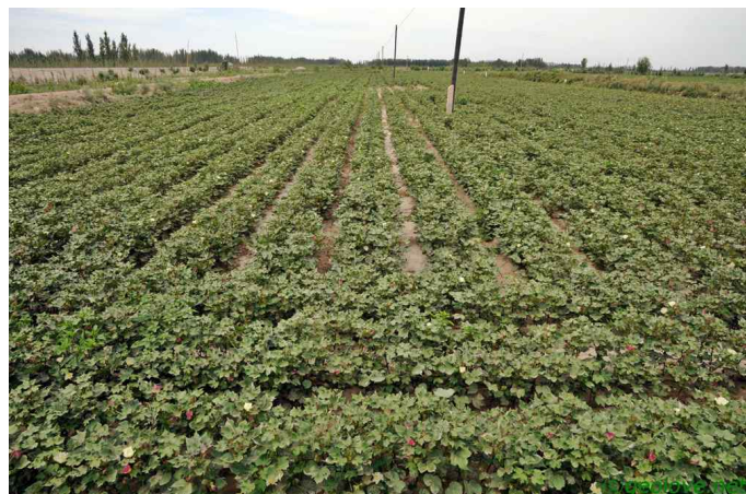
그림 8. 사차현 목화밭