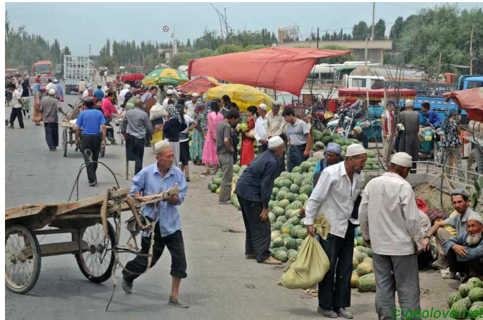
그림 7. 장보는 사람들