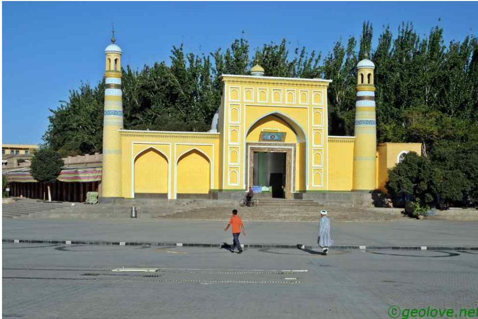
그림 14. 카슈가르의 이슬람사원