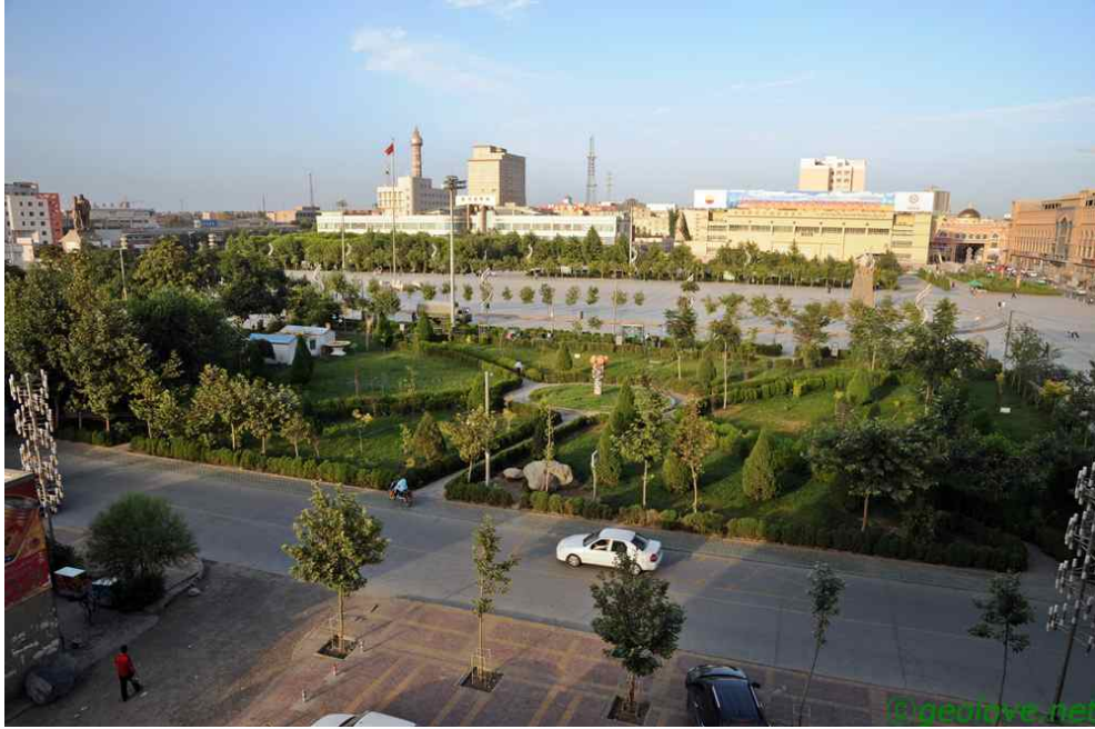
그림 1. 호탄의 단결광장. 왼편 끝에 마오와 악수하는 나귀타고간 위구르인 동상.

어떤 의미로 마지막 일정이 시작된다. 카슈가르가 마지막 종착지이니, 오늘이 실제로 마지막 일정인 셈이다. 안타깝게도 아침에 심한 배탈을 하였다. 온갖 약을 더 먹었다. 그런 것이 아무런 도움이 되지 않았다. 조심하느라 무진 노력을 기울였지만 결국 배탈이 나고 말았다. 그나마 위안을 삼는 것은 이제 말미라 다행이다. 한 시간을 달리는 것이 어려웠다. 오후에 접어들려 하니 거의 탈진하는 느낌이었다. 하지만 물을 마실 수 없었다. 점심이 그리웠다. 점심이면 쌀 삶은 것이라도 먹을 것을 기대하였다. 하지만 점심은 시간이 늦어지면서 예정에 없던 예청이란 곳에서 먹게 되었다. 언젠가 먹었던 비빔국수였다. 하늘이 노랬다.