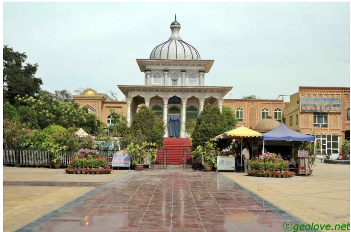
그림 9. 사차 왕비묘

영길사에 다다르기 전 꽤나 넓은 저수지가 있다. 그 저수지 건너에 소나기가 쏟아지고 있다. 저 소나기가 사막에서는 엄청난 일을 할 것이다. 이제 주변의 하천은 범람하고 마르던 초목이 다시 푸른빛을 낼 것이다. 영길사로 가는 길에 아니나 다를까 넘치는 강물을 볼 수 있었다. 영길사는 무슨 절인가 하였더니 동네 이름으로 칼이 유명한 곳이라 한다. 위구르인들이 작은 칼을 만드는 곳으로 유명한 동네인 것 같다. 곳곳에 칼이 서 있고, 가게가 즐비하다. 무슬림 남자들은 허리에 작은 칼을 차고 다닌