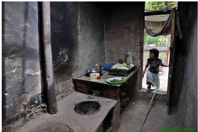
그림 4. 점심 준비중!

집을 따라가 보았더니 그 집에는 우리의 툇마루 같은 것이 있었다. 이제부터는 대부분 그런 집을 보았다. 날이 더우니 그런 곳에서 잠을 자기도 한단다. 그 집도 역시 점심을 준비하고 있는 것 같다. 온갖 야채를 썬 것이 프라이팬으로 들어갈 채비를 하고 있다. 잘 이해가 안 되는 것은 모든 부엌의 지붕이 없다는 것이다. 그렇게 흙먼지가 날리는데도, 그 집도 예외는 아니었다. 아마도 차를 끊는 것으로 보이는 주전자는 까맣게 그을음으로 범벅이 되어 있고, 그릇마다 흙먼지가 가득해보였다.