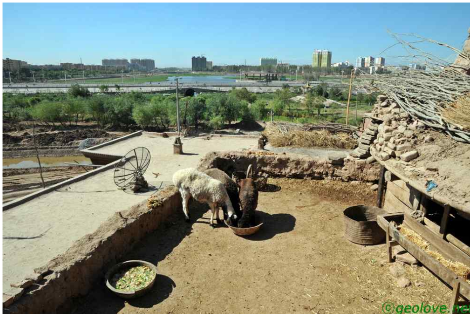
그림 13. 카슈가르의 일면