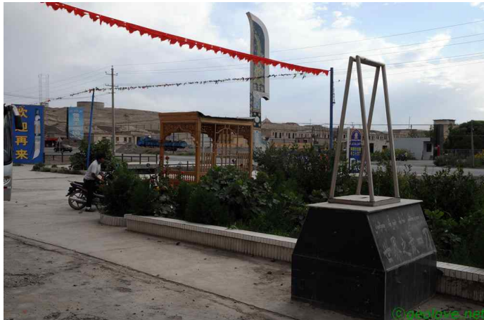
그림 12. 영길사의 칼

날이 바뀌었다. 오늘은 우루무치를 경유하여 북경으로 간다. 오전에 청진사와 향비묘, 박물관. 옛거리 등을 들릴 예정이다. 다행스럽게도 배탈은 어제보다 훨씬 좋아졌다.