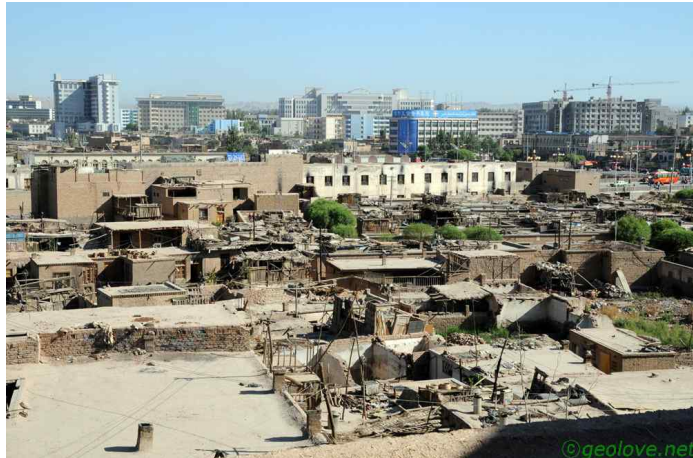
그림 16. 카슈가르의 옛과 오늘

이 동네는 옛과 현대가 공존하고 있다. 생활은 현대이지만 그 들의 터전은 옛이다. 그들의 집 옥상에 올라서 보면 확연하게 옛과 오늘이 보인다. 이 마을 뒤로는 현대식 빌딩이 올라서고 있고, 그 빌딩이 보이는 바로 앞에서는 옥상에서 양들이 풀을 뜯고 있다.