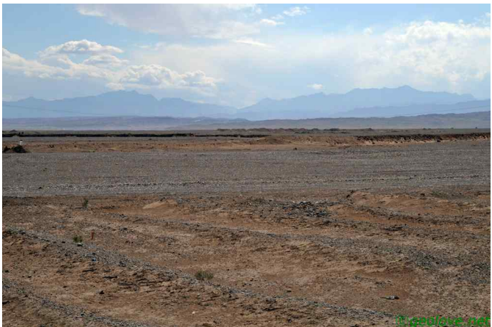
그림 10. 카라코람산