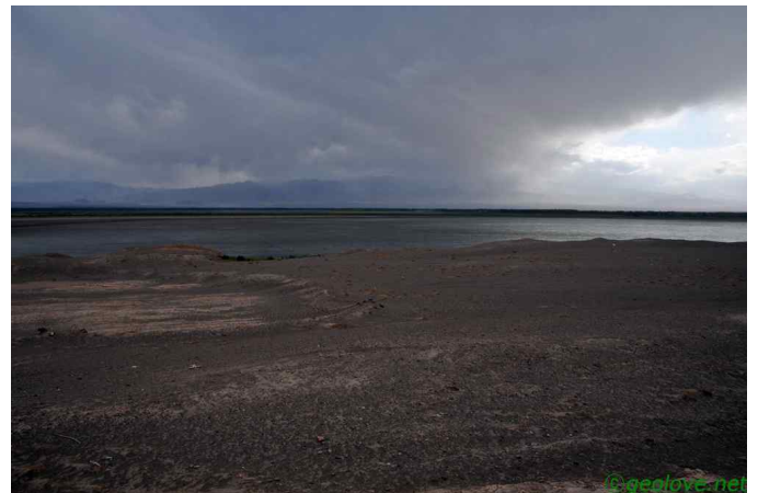
그림 11. 카라코람산에 쏟아지는 소나기와 저수지