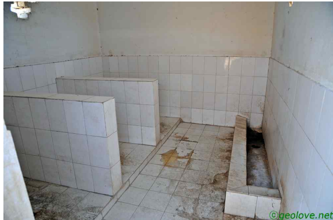
그림 3. 아주 양호한 화장실

비슷한 경관이 이어졌다. 민풍까지와 크게 달라진 것은 어제부터 길을 따라서는 초록빛이 많은 것이다. 사안이라는 작은 마을에서 집안에 들어가는 것을 처음 거절당하였다. 젊은 여인네가 점심을 준비하고 있는 모양이었다. 물론 문이 닫혀 있었다. 가이드 말에 의하면 남자가 없다는 뜻이란다. 흙먼지가 쏟아질 듯 날리는 가운데 뽕가를 기름에 볶고 있었다. 할 수없이 집을 나왔다. 잠깐 화장실을 들렀는데, 화장지가 내려가질 않는다. 바람이 불면서 버리는 화장지가 자꾸만 위로 올라오려고 한다. 물론 화장실은 중국 화장실이며, 주유소에 달린 것이다. 한 아이가 안내하는