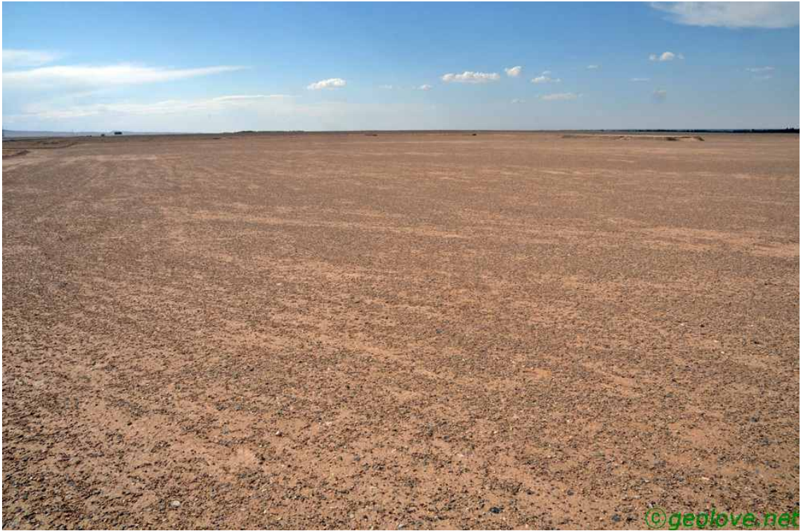
그림 18. 카슈가르코 가는 길의 사막