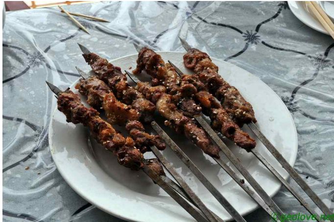
그림 6. 양꼬치 구이

은백양나무를 심어놓았다. 과연 살아날까 하는 생각이 들 정도로 막대기를 쫓은 것 같지만, 저게 무성하게 자라날 것이다. 다섯 시를 훌쩍 넘어서 사차현 현성에 들어섰다. 사차는 해발고도 약 1,200m에 있으며 실크로드 서역 남로 상의 중요한 오아시스였다. 하지만 우리는