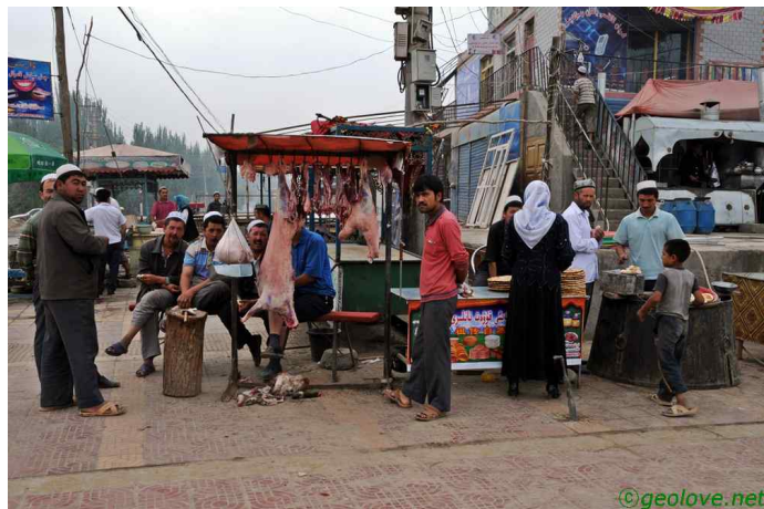
그림 2. 시골의 장(목욕현)

호탄에서 목욕현 사이에는 논이 넓게 발달하고 있다. 하지만 차를 세워달라고 말하기도 귀찮았다. 하루가 빨리 지났으면 하는 생각이 꿈틀거렸다. 목욕현은