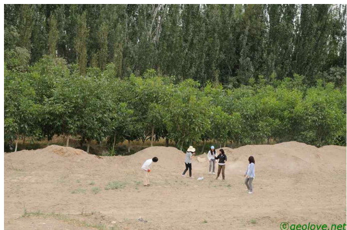
그림 5. 화장실, 호두과수원을 다녀온 사람들

카스로 향하는 길가에 호두나무 과수원이 넓게 발달하였다. 역시 땅이 귀한 동네라 그 사이에서는 다른 농사를 짓고 있다. 말을 수확하고 나서 옥수수를 심었