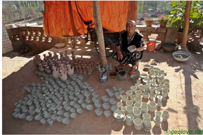
그림 17. 옛거리에서 도자기 굽는 아주머니